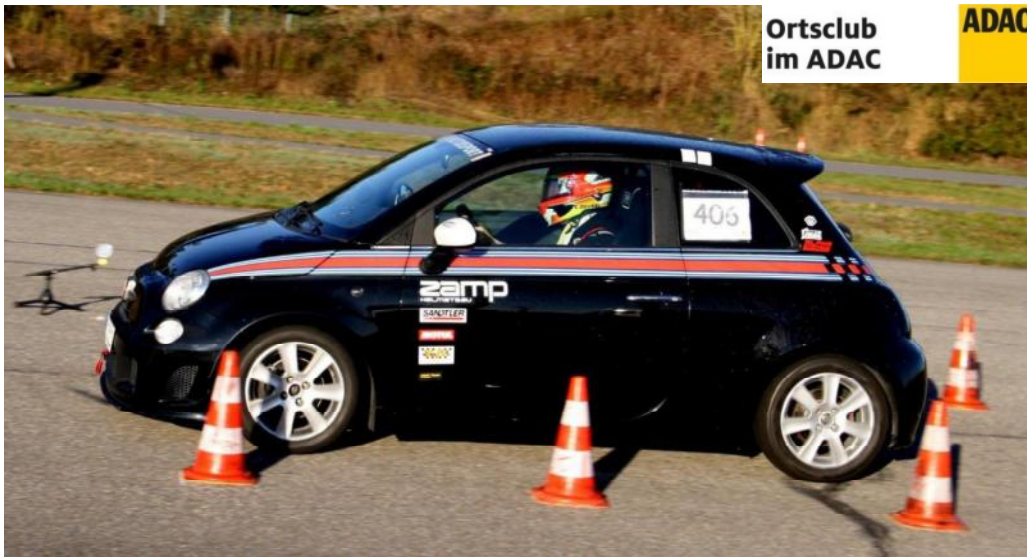
Christian Deubel 2021

Pokale für jeden Klassensieger Pokale oder Sachpreise für 30% der Platzierten !!! Achtung !!! Teilnehmerzahl ist auf 80 begrenzt